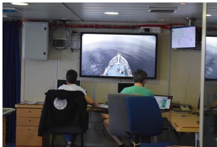
Vue de l'Atalante pendant la mission : le Pacifique est vraiment pacifique !