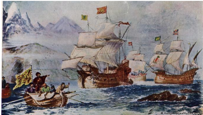
1520, Ferdinand Magellan (1480 - 1521) et la découverte du passage vers le Pacifique

Le navigateur l'a en effet baptisé ainsi en 1520, lors de son tour du monde, en raison du temps clément qui a accompagné tout son voyage sur ses eaux pendant un peu plus de trois mois, depuis le sud de l'Amérique jusqu'aux Philippines.